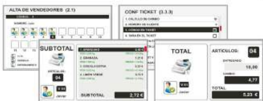
Display COLOR. Ejemplos de pantallas de venta y de configuración