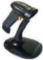
Lectores códigos de barras

MARQUES - GODEX - ZEBRA - DIBAL - CITIZEN CONSUMIBLES