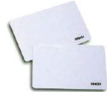
Tarjetas y lectores RFID