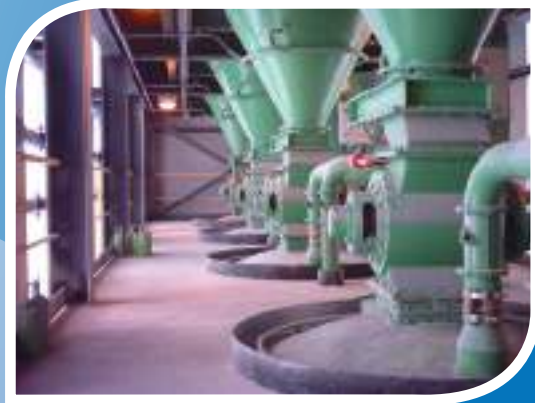
BÁSCULAS Y BALANZAS